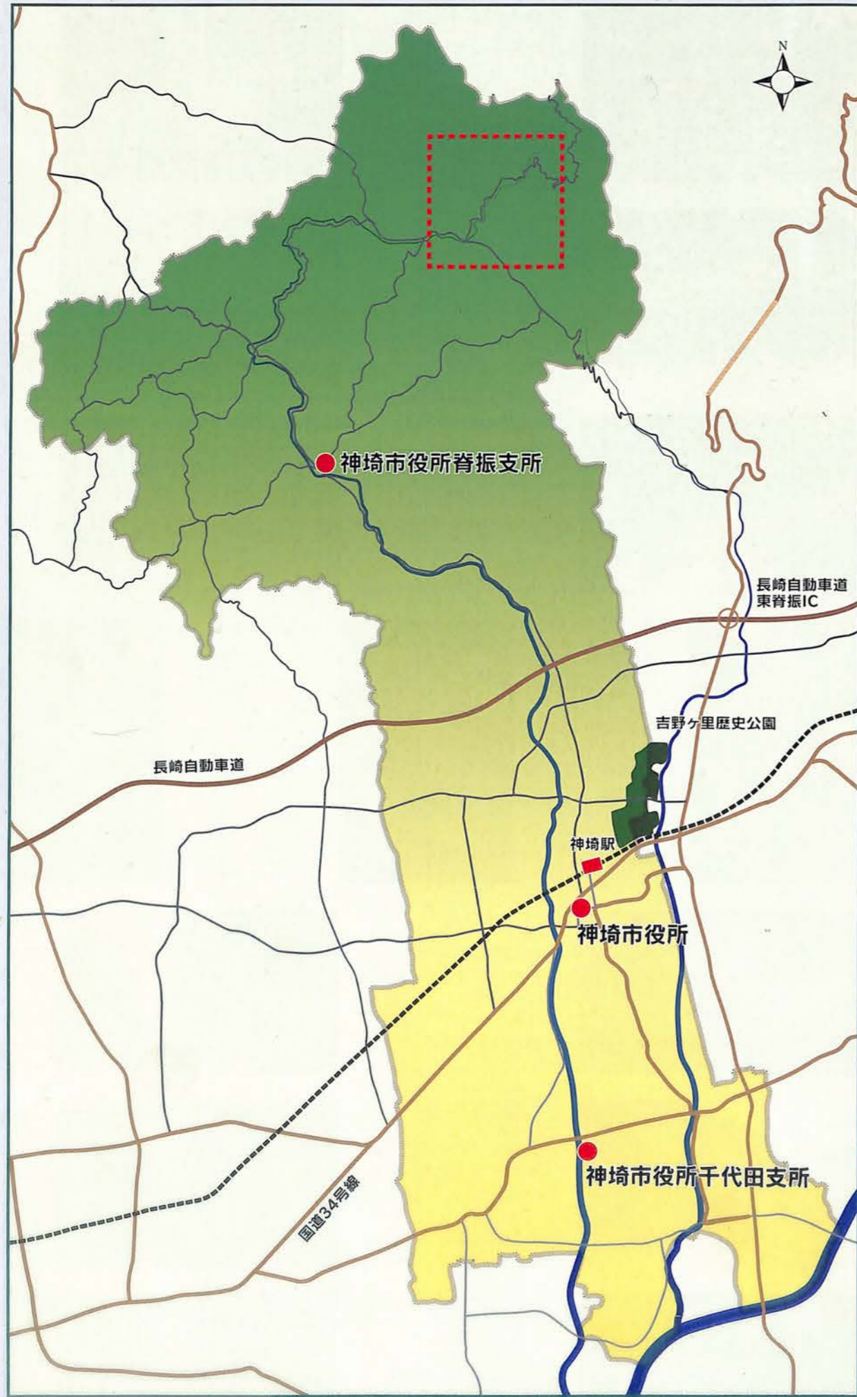
No.13 散策マップの位置と範囲